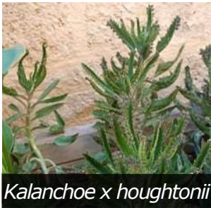
Kalanchoe x houghtonii