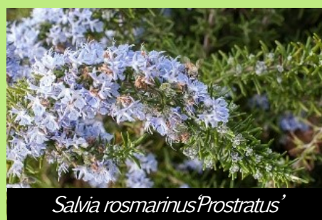
Salvia rosmarinus 'Prostratus'