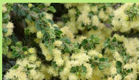
Acacia howittii 'Clair de lune'