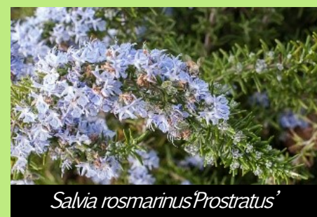
Salvia rosmarinus 'Prostratus'