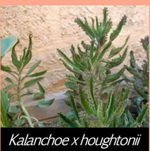
Kalanchoe x houghtonii